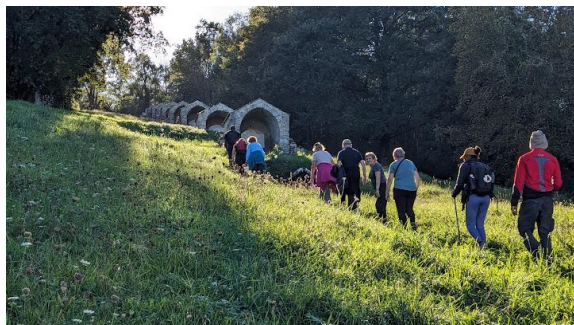
Son calvaire avec ses 12 oratoires

La chapelle-haute tout en haut du calvaire où nous célébrons les vêpres en chantant « Joyeuse lumière, splendeur éternelle du Père, Saint et Bienheureux Jésus-Christ »